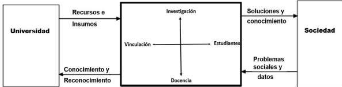
Figura 1. Proceso investigación-docencia-conocimiento