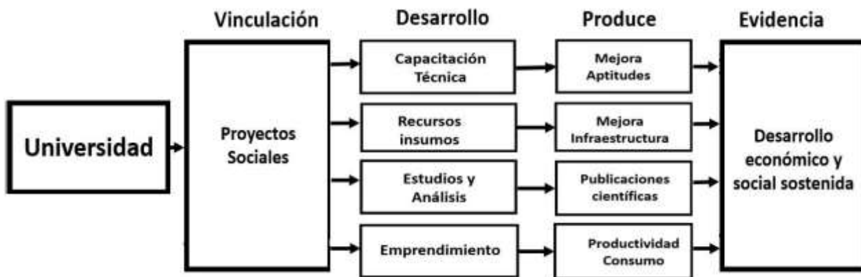
Figura 2. Vinculación y sus efectos en la sociedad

La Organization for Economic Cooperation and Development (OECD, 1996) establece que el desarrollo y productividad de la vinculación de las organizaciones es el resultado del crecimiento y mejora de la investigación. Los beneficios que la vinculación aporta son actualización tecnológica, proyectos sociales comunitarios, analizando situaciones de necesidades en campo, apoyando iniciativas, desarrollo de habilidades hacia la mejora de negocios y emprendimiento generando el circulante beneficio de la sociedad (Figura 2). Por lo tanto, se obtiene un beneficio económico que se evidencia con la difusión de la información obtenida generada de las investigaciones y mejorando el nivel de vida con responsabilidad social de los universitarios (De la Cruz y Santos, 2008; Méndez, 2021).