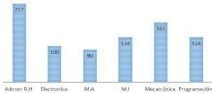
Figura 2. Encuestas por especialidad