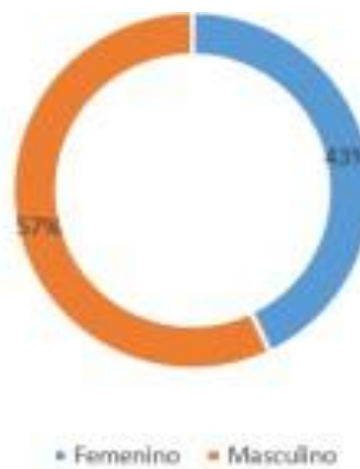
Figura 3. Sexo de los estudiantes